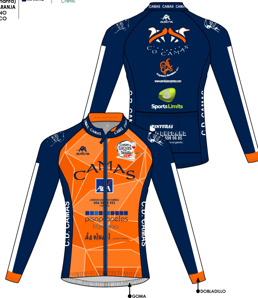
MAILLOT ML PRO-AM INVIERNO CRO CREMALLERA LARGA REF:CIMT015