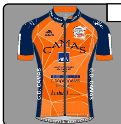
MAILLOT MC PRO-AM 014 ADN CREMALLERA LARGA REF:CIMT014