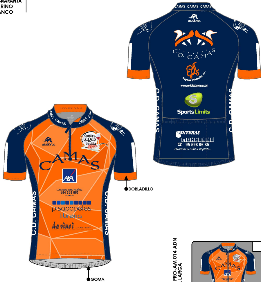
MAILLOT MC PRO-AM VERANO CRO CREMALLERA CORTA REF:CIMT013